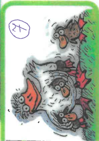
kachny mají káčátka,