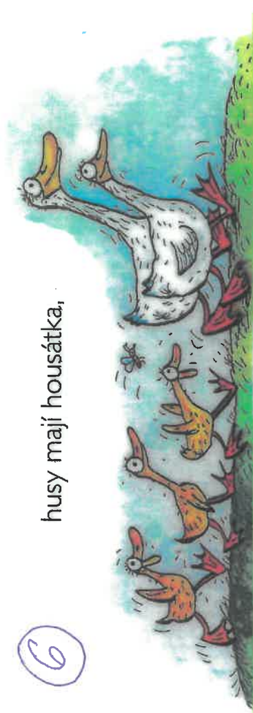
husy mají housátka,