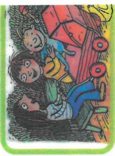
mámy mají miminka jako moje maminka.