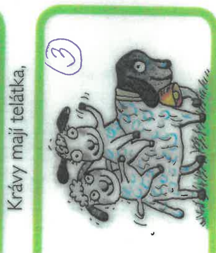
ovce mají jehňátka,