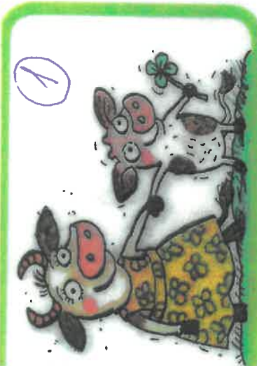
Krávy mají telátka,