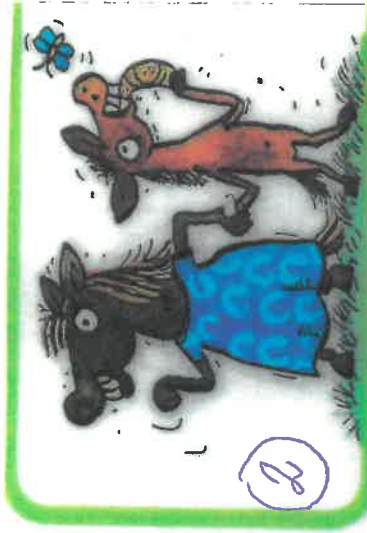
klisny mají hříbátka,