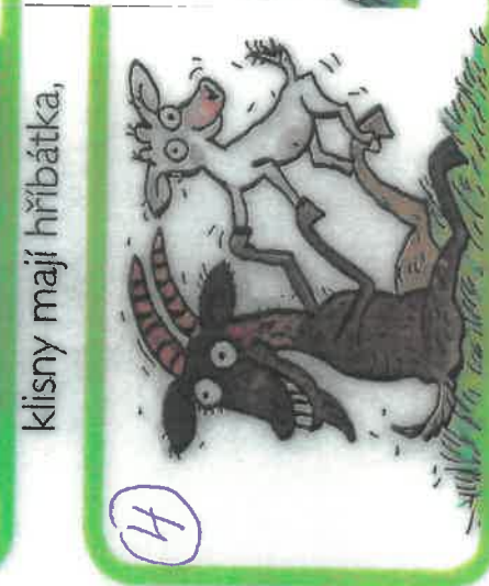
kozy mají kůzlátka,