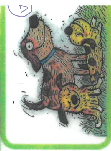
fenky mají štěňátka,